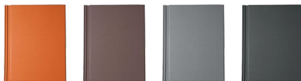
ceglany brąz kolonialny ciemnoszary grafitowy